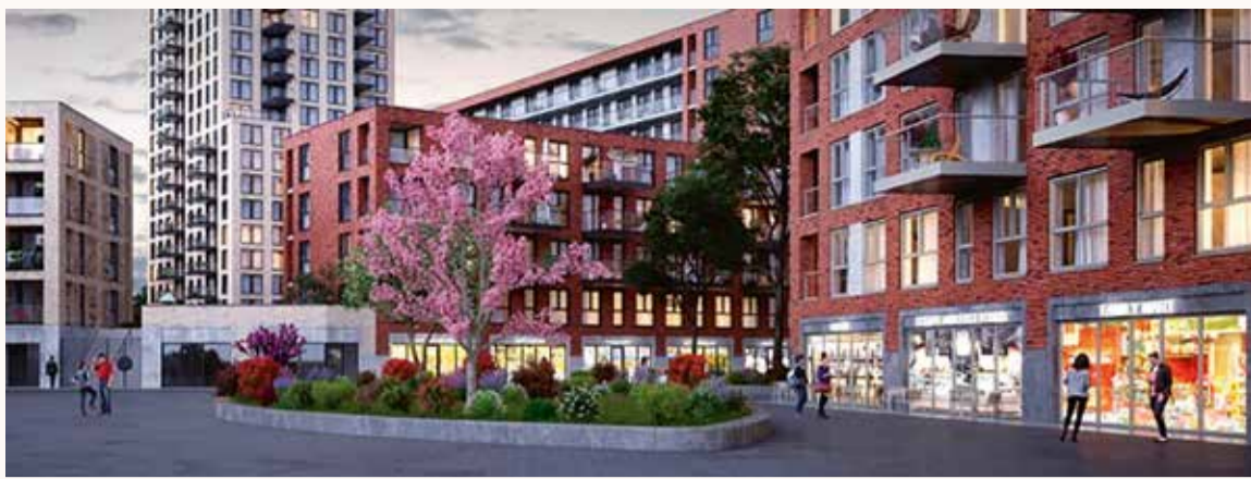
Commerciële ruimtes Els Borst-Eilersplein

Helaas kunnen wij u in deze wijkkrant nog geen exacte datum geven wanneer het Wijkcentrum heropend wordt. Maar volgens richtlijnen van de rijksoverheid kunnen de dorps- en buurthuizen en ontmoetingscentra weer open vanaf 1 juni. De openstelling is voor maximaal 30 mensen, uitgaande van de basisregels van 1,5 meter afstand. Wijkcentrum Leyenburg volgt de richtlijnen zoals bepaald door het RIVM en de Rijksoverheid. Daarbij treffen wij aantal extra maatregelen om verspreiding van het virus tegen te gaan. De exacte datum van opening kunnen wij op dit moment nog niet communiceren maar zullen wij doen via sociale media en het publicatiebord in het winkelcentrum bij de Albert Heijn.