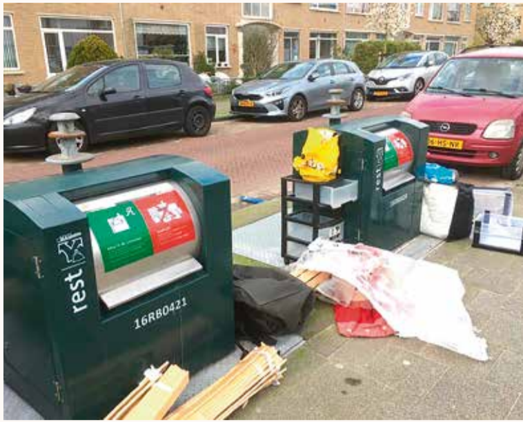
Deze bewoner kan kennelijk niet lezen dat je grofvuil niet NAAST de ondergrondse container plaatst maar dat je een afspraak maakt met de gemeente om het gratis af te laten halen.

Op de site van de gemeente den haag kunt u een afspraak inplannen om uw grofvuil gratis en zonder boete te laten ophalen. www.denhaag.nl/nl/afval/grofvuil-of-tuinafval-laten-ophalen