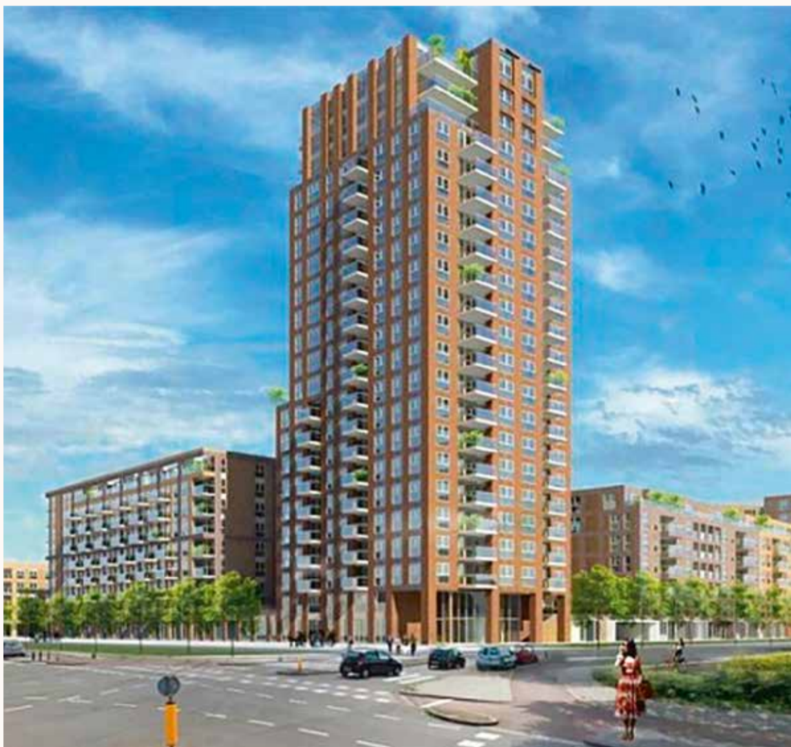
Het Haagsche Kwartier nadert haar voltooiing

Dat alles vraagt nog veel aandacht voor de - al sinds oktober 2005 - met dit grote project actief zijnde vrijwilligers uit Leyenburg, en later Houtwijk. HULDE!